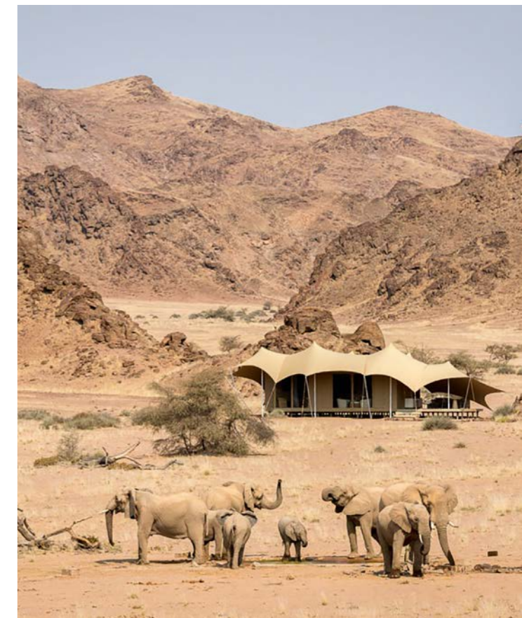
Hoanib Skeleton Coast Camp

All das familiengerecht zu organisieren, benötigt bestimmt viel Feingefühl bei der Rundreiseplanung! Oh ja, aber es gibt tatsächlich nichts Schöneres und Erfüllenderes für mein Team und mich, als unsere Kunden mit perfekt geplanten, abwechslungsreichen Reiserouten zu begeistern. Da wir die angebotenen Reiseziele selbst intensiv bereist haben, wissen wir genau, auf welche Details zu achten ist, um die Reise auch für die jüngsten Reisetilnehmer angenehm und spannend zu gestalten. Diese wundervolle Namibia-Rundreise sowie weitere Reiseinspirationen können sich interessierte Familien auf der Website www.the-family-project.com unter der Rubrik Reiserouten ansehen. ■